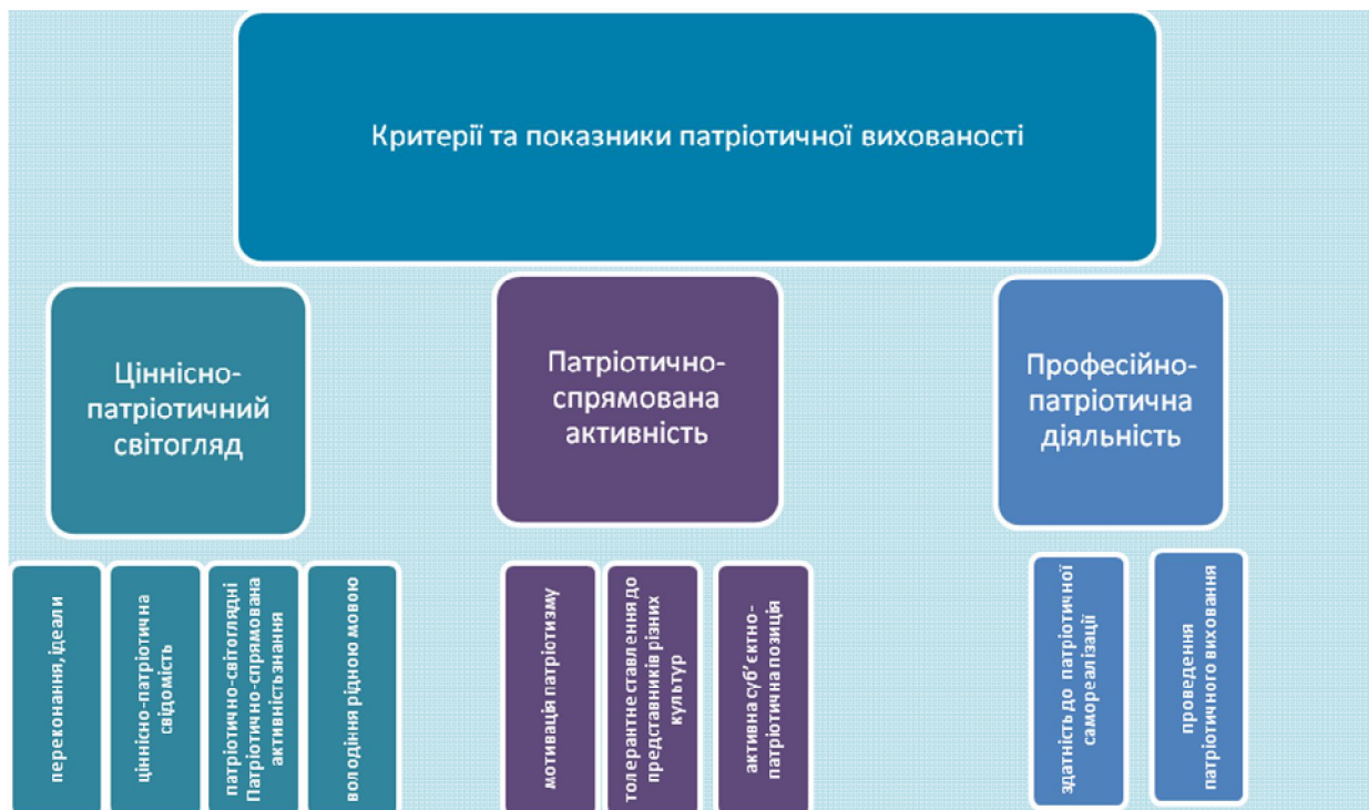
Рис. 1 Критерії та показники патріотичної вихованості.

країни, готовність до захисту Вітчизни); когнітивний (системність і цілісність професійних та особистісних знань, здатність до їх інтеграції для здійснення майбутньої професійної діяльності та життєдіяльності); емоційний (глибина вираження патріотичних почуттів до України, до свого народу; повнота переживань краси рідної природи, видатних пам'яток минулого, творів народного і сучасного мистецтва; вияв емпатійності, толерантності у ставленні до батьків, рідних, колег по навчанню, викладачів, старших; наявність бажання, у разі потреби, надати допомогу іншим); діяльнісний (системність, ґрунтовність професійних умінь, їх взаємопов'язаність з особистісними якостями, спрямованість на високу продуктивність майбутньої професійної діяльності); рефлексивний (наявність рефлексивних та само регулятивних умінь; здатність до рефлексії при розробці проекту власного особистісного зростання) [9, с. 12]. На рисунку 1 представлено критерії та показники патріотичної вихованості студентів.