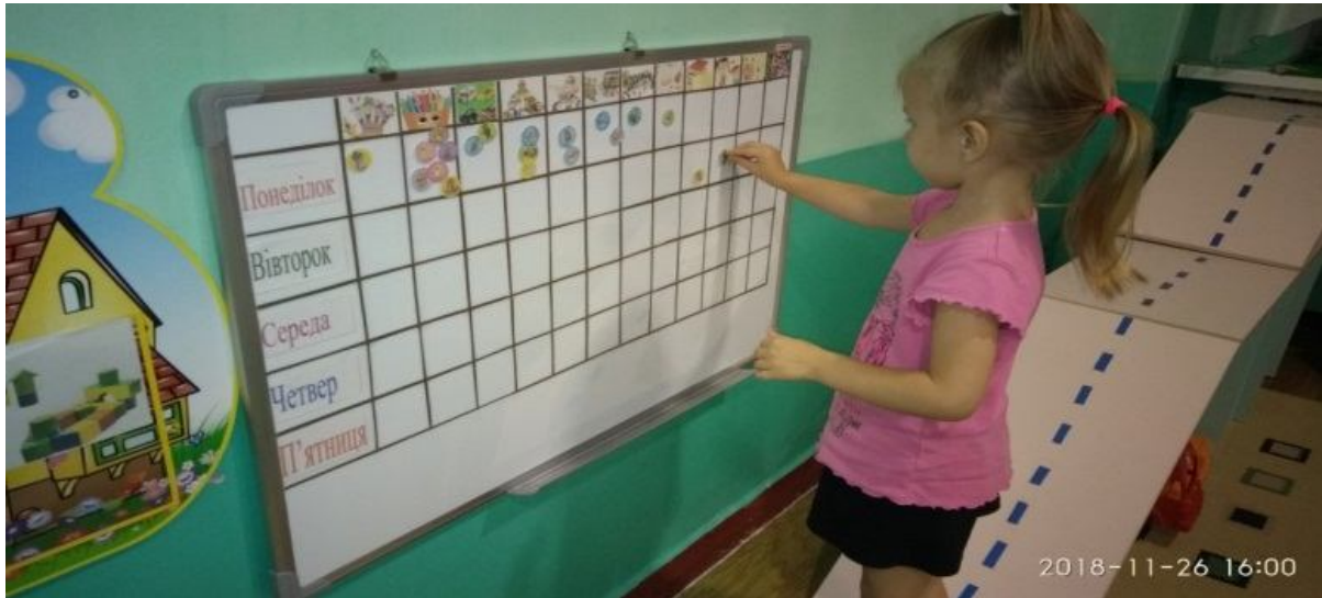
Фото 1. Екран вибору діяльності

несе відповідальність за свій вибір та діяльність (“я хочу цим займатись”) (фото 1.).