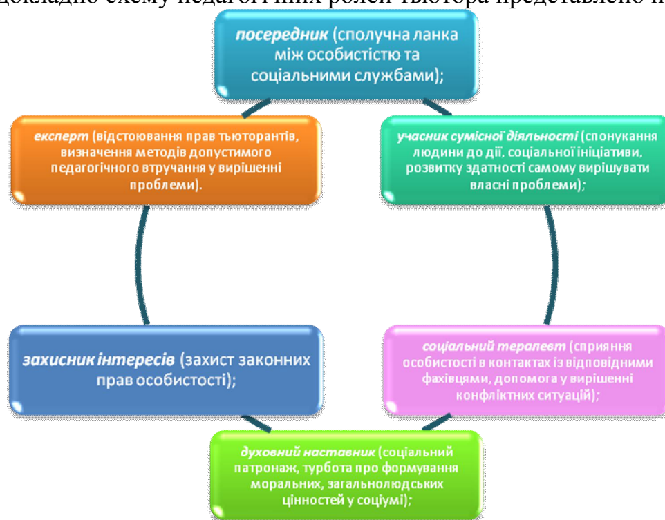
Рисунок 2. Педагогічні ролі тьютора.

Професійна діяльність тьютора пов'язана з його вміннями. Серед основних педагогічних ролей тьютора визначають наступні: посередник, захисник інтересів і прав, учасник сумісної діяльності, соціальний і духовний наставник, соціальний конфліктолог-терапевт, експерт-правник. Більш докладно схему педагогічних ролей тьютора представлено на рис. 2.