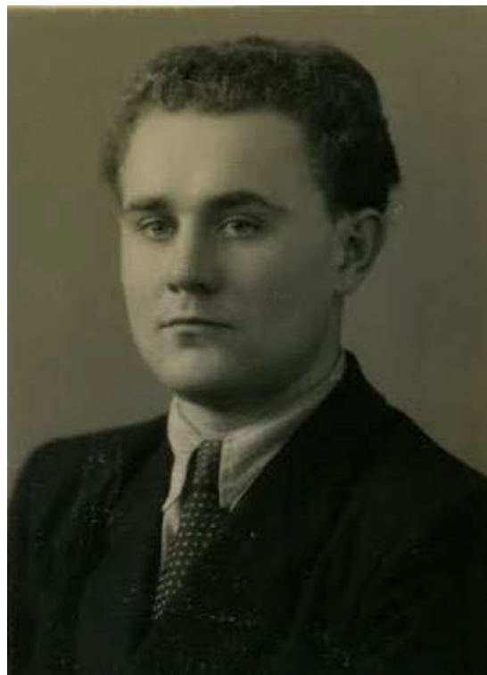
Кандидат педагогічних наук 1959 р.