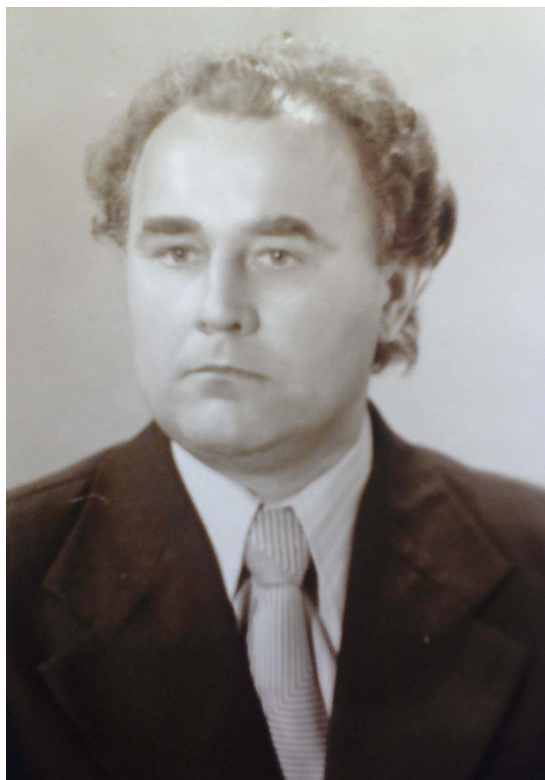
Доцент кафедри української мови 1964 р.