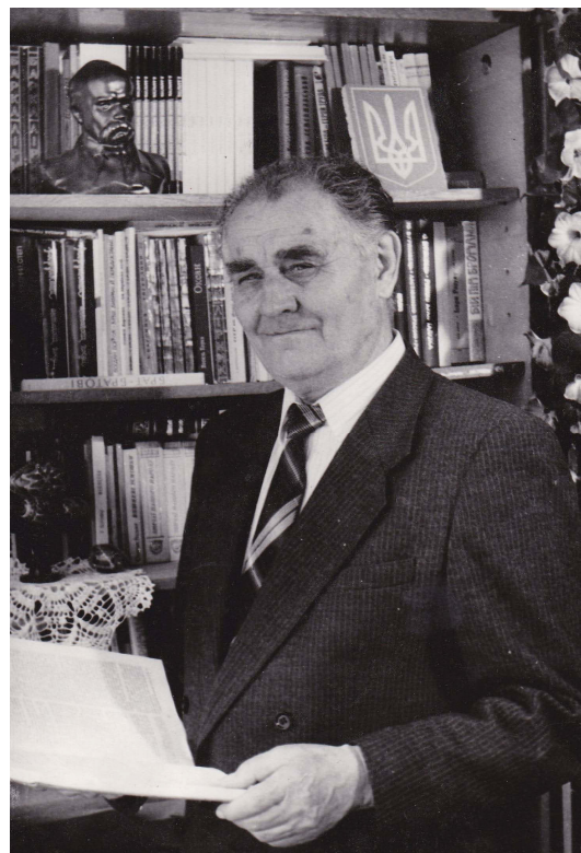
Професор кафедри української мови та літератури, декан філологічного факультету 1997 р.