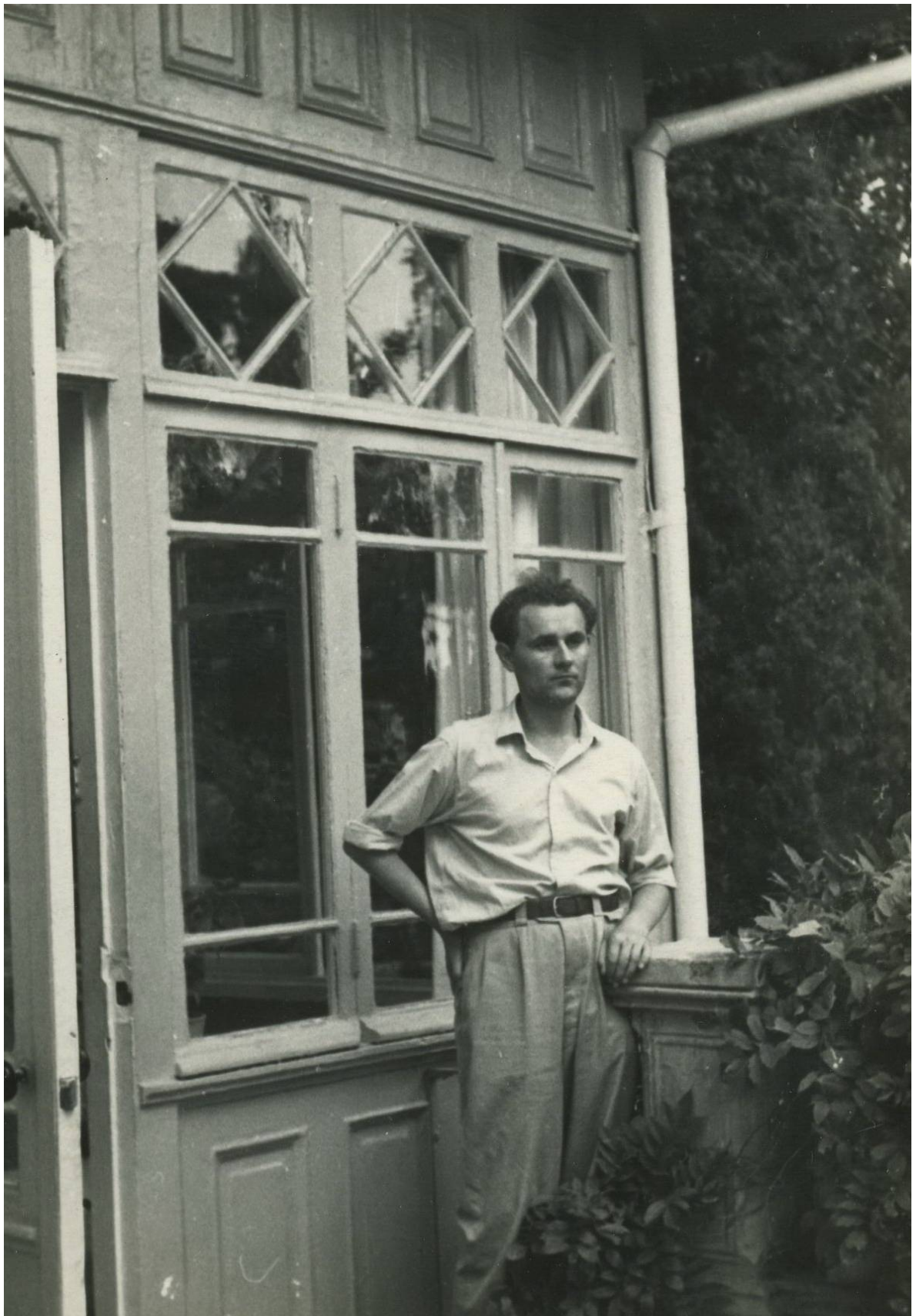
Біля Будинку-музею А.П. Чехова. Ялта, 1961 р.