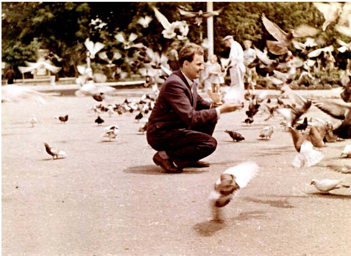
Під час подорожі до Канева. 1962 р.