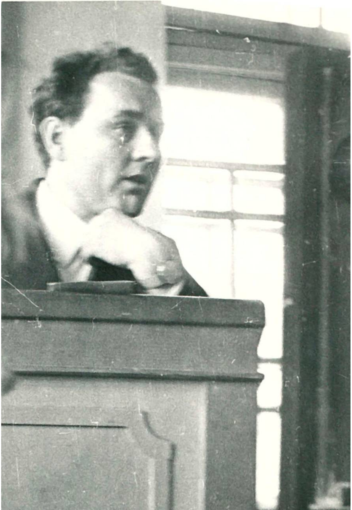
На лекції для вчителів. Вінниця, 1965 р.