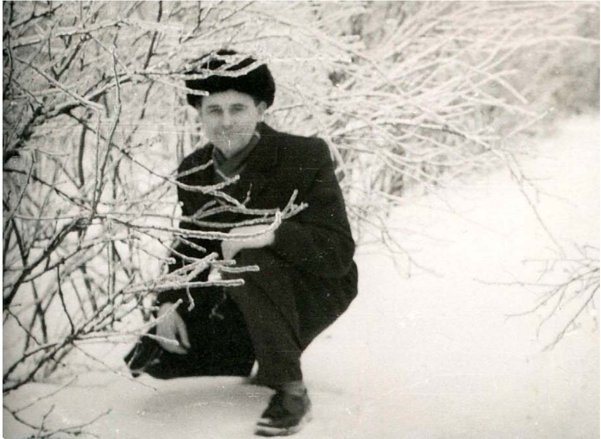
Під час прогулянки вінницьким парком. 1964 р.