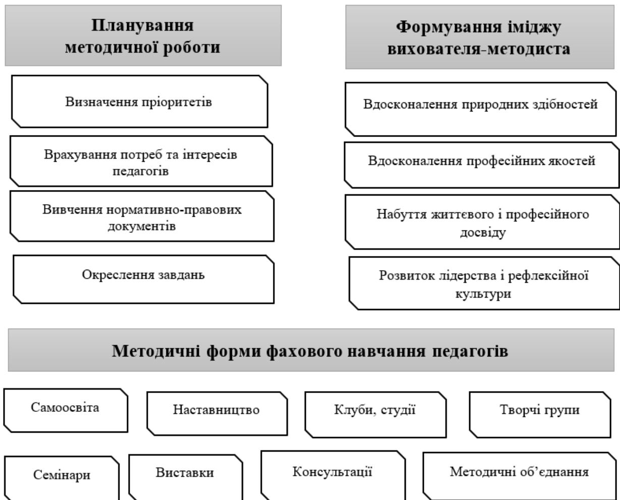
Рис. 3.2. Складники методичної роботи в закладі дошкільної освіти

У результаті аналізу науково-практичних праць можемо підсумувати важливі питання, порушені сучасними дослідниками: планування методичної роботи; формування іміджу вихователя-методиста; використання інноваційних та інтерактивних методичних форм фахового навчання педагогів (рис. 3.2).