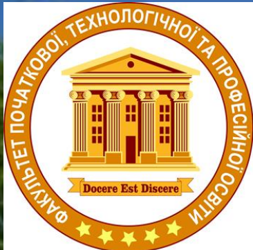
РИСУНОК І ЖИВОПИС